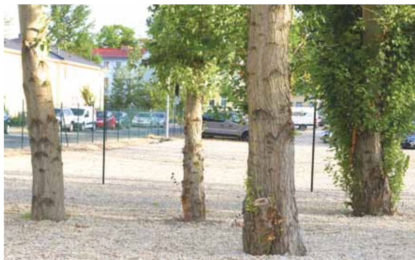
Bezirksamt vermutet dauerhafte Schäden an den Bäumen