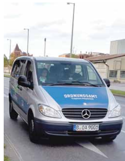
Das Ordnungsamt unterwegs

Die Restaurierung der Friedhofskapelle ist mit der Unteren Denkmalschutzbehörde des Bezirks abgestimmt und wird von ihr ausdrücklich begrüßt und befürwortet.