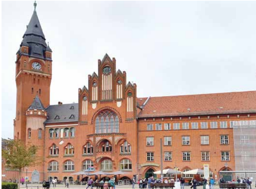
Bekannt aus der Geschichte des Hauptmanns von Köpenick: Das Köpenicker Rathaus

Ausgabe Nr. 217 November 2015 Fraktion DIE LINKE in der BVV Treptow-Köpenick