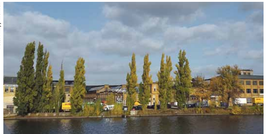
Wohnungsbau auf dem Gelände der Rathenau-Hallen?

Jährlich ziehen über 40.000 Menschen nach Berlin – doppelt so viele wie allein heute in Oberschöneweide leben. Entsprechend steigt die Nachfrage nach Wohnraum und damit klettern die Mieten. Zwar setzt sich DIE LINKE besonders für öffentlichen und genossenschaftlichen Wohnungsbau ein, aber ohne die Bebauung auch privater Flächen wird es nicht gehen. Dabei dürfen Grünflächen und Denkmalsubstanz, das, was die Identität der Stadt ausmacht,