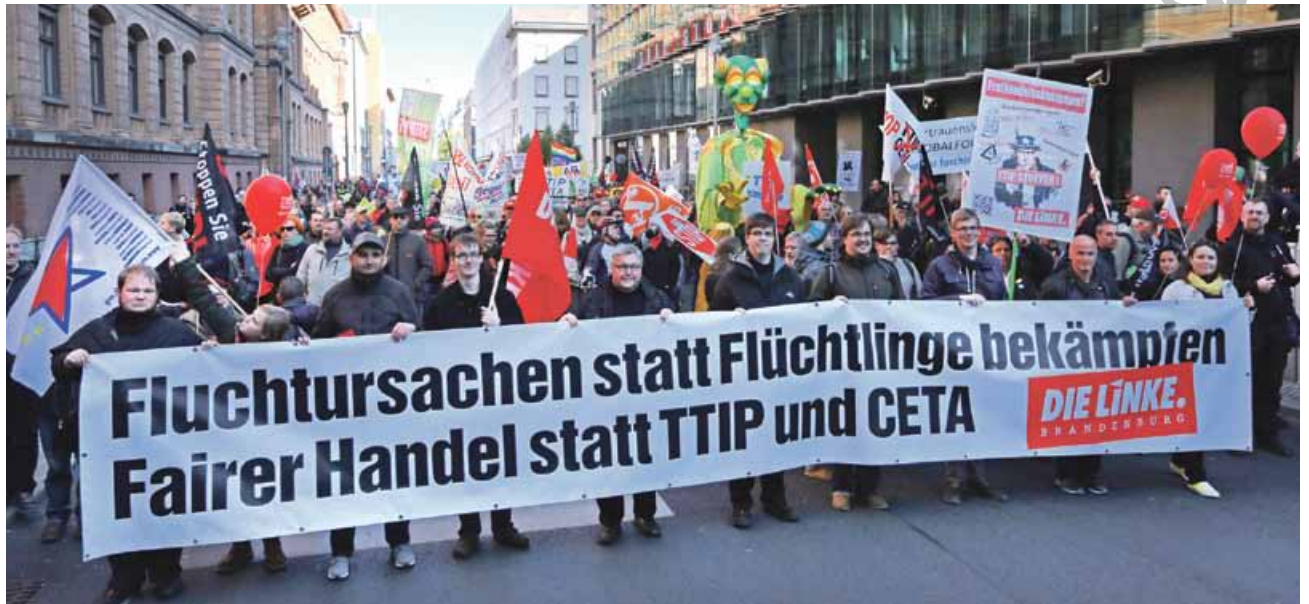
Eine Viertelmillion Menschen demonstrierten im Oktober in Berlin gegen TTIP.