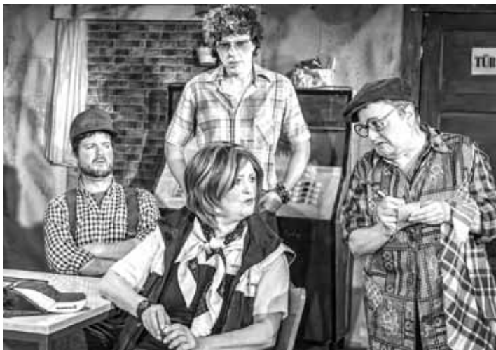
Szenenfoto aus der Komödie „Bauern suchen Frauen – Landeier“ im Stadttheater Cöpenick.