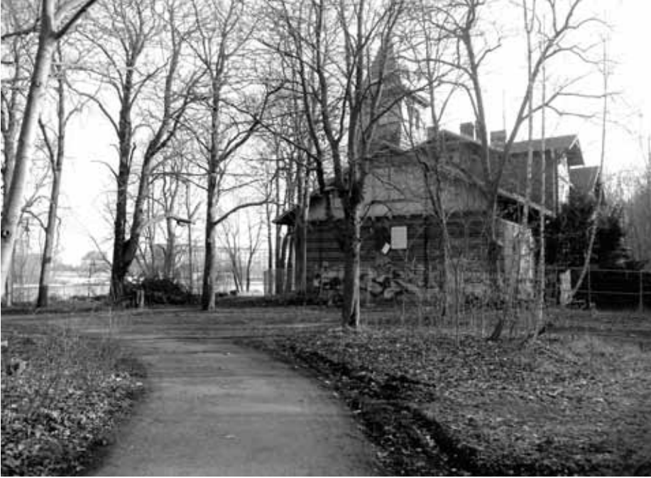
Fuß- und Radwege müssen instandgesetzt werden.