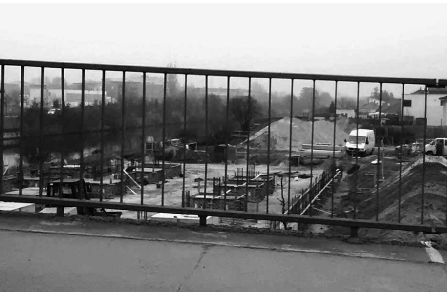
Für einen Uferweg an dieser Stelle müssten Bund und Land die Finanzierung übernehmen.