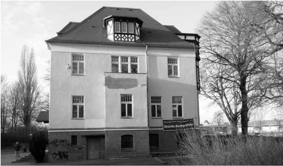
Die Hasselwerder Villa könnte jetzt zur Heimat der Moving Poets werden.