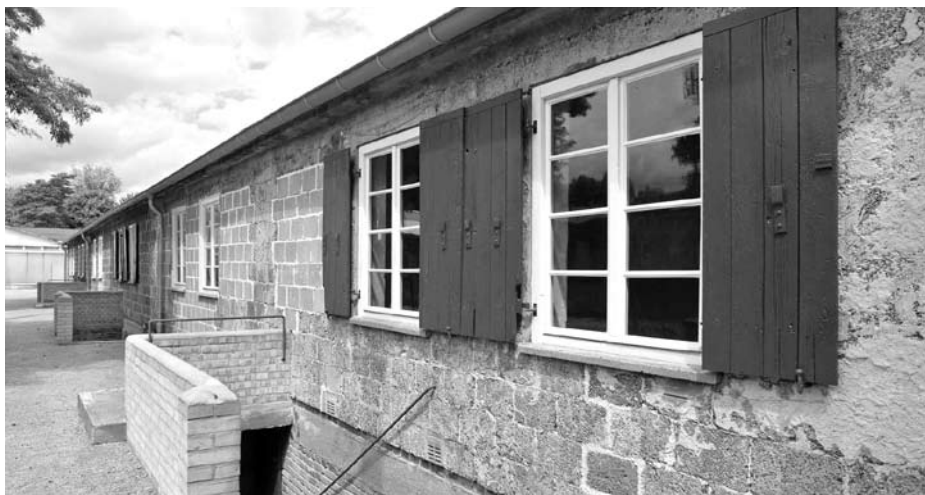
Baracke 13, Foto: Dokumentationszentrum NS-Zwangsarbeit Berlin, Hoffmann

Darüber hinaus braucht Griechenland eine Art Marshallplan zur Stärkung von Investitionen und Wachstum statt kontraproduktiver und unsozialer Sparpakete. Erst dann ist ein geordneter Schuldenschnitt möglich.