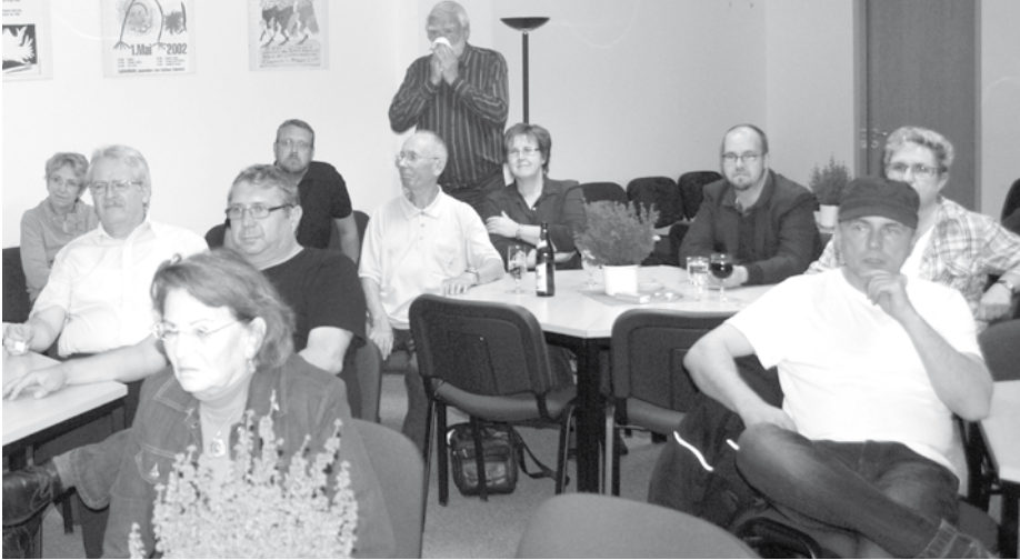
Gespannt beobachteten Mitglieder und Gäste bei der Wahlparty am Wahlabend im Büro der LINKEN Treptow-Köpenick die Hochrechnungen.