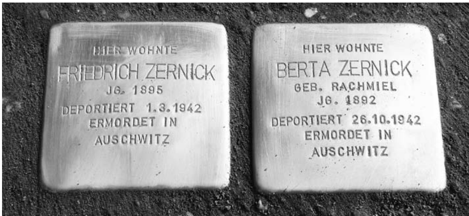
So wie für das Ehepaar Zernick am Mandrellaplatz 1 wurden an zahlreichen Punkten Treptow-Köpenicks Stolpersteine angebracht.